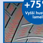
indikátor opotřebenosti – zima (4 mm)